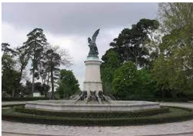
Fuente del Ángel caído

Contra más lo veo más lo admiro, no sé si es querubín o demonio pero forma parte del patrimonio pues un ángel se quedó en el Retiro